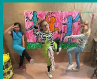
- ARTS PLASTIQUES -

Toute notre offre sur www.optimomesloisirs.com