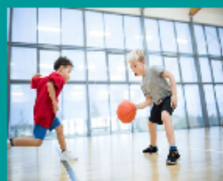
- MULTISPORTS -